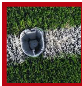
(1) Bote empotrado en el suelo.